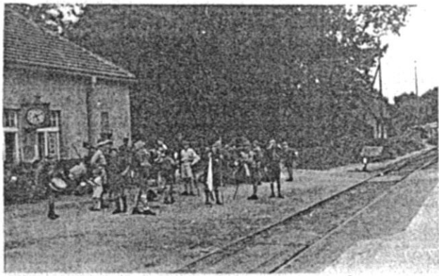
Stacja PKP - Tyarogóra