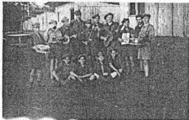
"Orkiestra i chór obozowy"