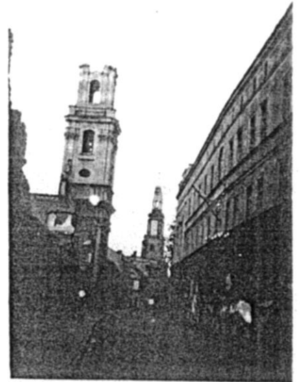
1948 - OLEŚNICA - MIASTO WIEŻ